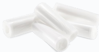
Vakuumrollen in vielen Größen