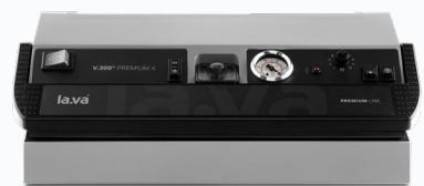
V.300 Premium X Vollautomatik Manometeranzeige 2-fach Schweißnaht

Alle Preise inklusive MwSt., ab 49 € Bestellwert versandkostenfrei in Deutschland