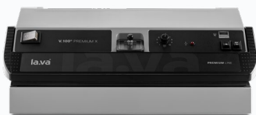
V.100 Premium X Halbautomatik Balkenanzeige 2-fach Schweißnaht