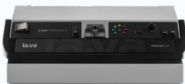
V.200 Premium X Vollautomatik LED-Anzeige 2-fach Schweißnaht