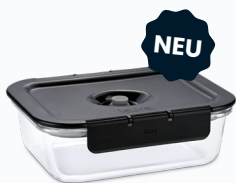
G-line Vakuumbehälter in versch. Farben