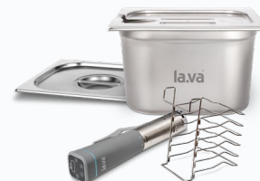
Sous-Vide-Set XXL Edelstahl