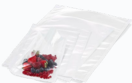
Vakuumbutel in vielen Größen